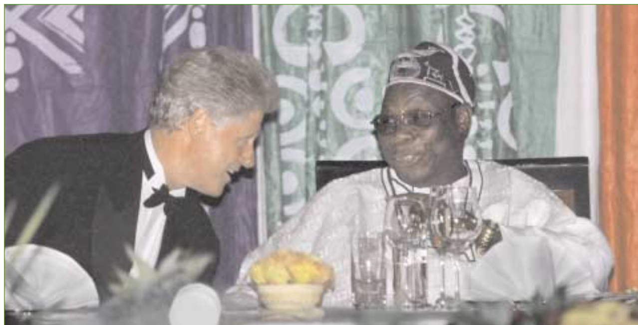
J. Scott Applewhite (AP/Wide World Photos)

Au cours d'une vie humaine, de la vie d'un pays et d'une civilisation, les riches et les pauvres échangent souvent leur place. Ce qui reste, c'est notre humanité commune. Si vous pouvez la découvrir en dépit de toutes vos différences et nous aussi en dépit des nôtres, et qu'alors nous puissions nous tendre la main des deux côtés de l'océan, à travers les cultures et les différentes histoires, en vue d'un avenir commun pour tous nos enfants, alors la voie de la liberté l'emportera. ■