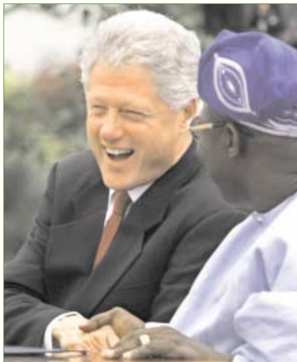
J. Scott Applewhite (AP/Wide World Photos)

et de promouvoir le commerce et les investissements de manière à faire profiter davantage des bienfaits de la prospérité un peuple qui a choisi la démocratie.