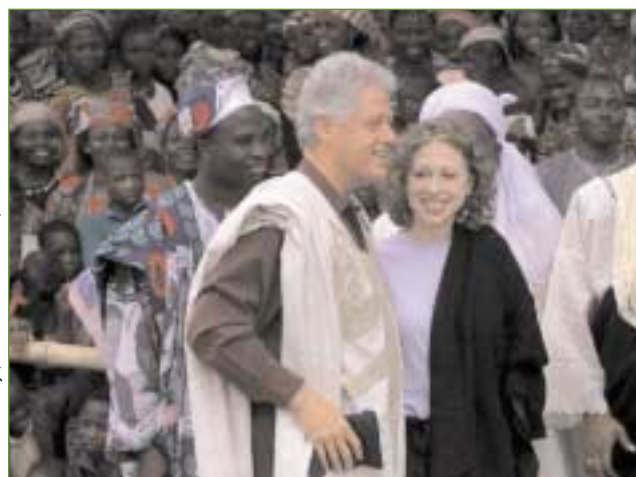
Brennan Linsley (AP/Wide World Photos)