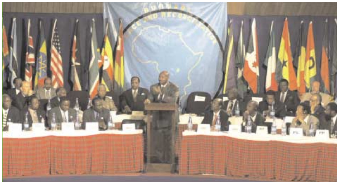
Le président ougandais Yoweri Museveni (debout), l'un des médiateurs aux pourparlers de paix sur le Burundi, s'adresse aux délégués réunis à Arusha (Tanzanie), le 28 août 2000.

Tôt ou tard, la haine, la vengeance et l'illusion selon laquelle le pouvoir exercé sur un autre groupe vous garantit la sécurité deviennent une véritable prison. Je ne vous demande pas d'oublier ce que vous avez subi durant ces années amères. Mais j'espère que lorsque vous rentrerez au Burundi, vous ne serez plus les prisonniers du passé, mais les bâtisseurs de l'avenir. Je vous le redis : si vous décidez, l'Amérique et le monde seront avec vous. Mais vous seuls devez décider si vous voulez donner un avenir à vos enfants. Je vous remercie. ■